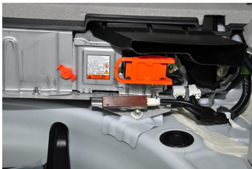
Servicestecker im Fahrzeug