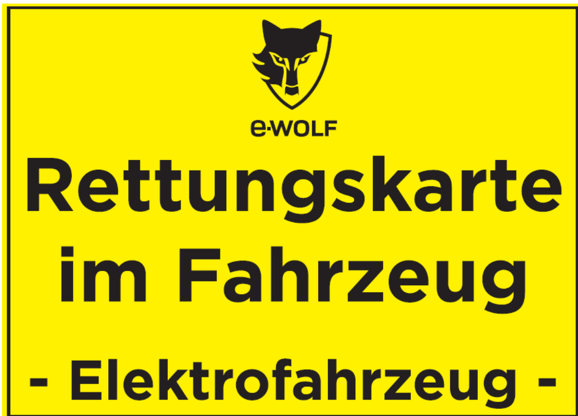
Beispiel Kennzeichnung der Fahrzeuge

Die Überprüfung der Funktionsfähigkeit der Sicherheitseinrichtungen führt die Verantwortliche HV Kraft durch.